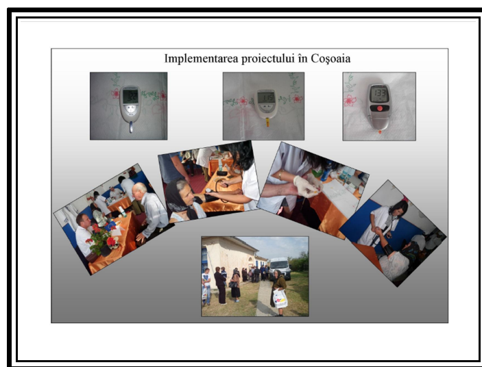
Implementarea proiectului în satul Coșoaia (analize gratuite de glicemie alături de alte seturi)

Problemele de sănătate ale locuitorilor orașului constituie una din grijile pe care conducerea acestui spațiu urban o gestionează cu deosebită prudență astfel încât sistemul sanitar din Videle să nu sufere transformări care să pună în pericol securitatea cetățenilor .