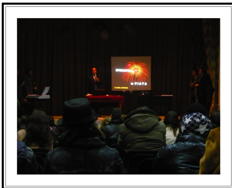
Scurta prezentare asupra riscurilor apariției diabetului